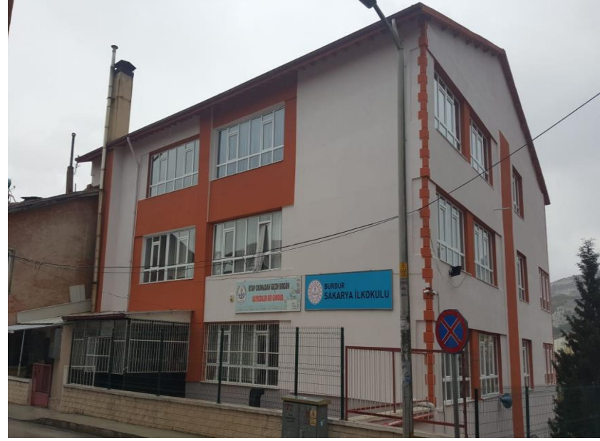
2019 yılı Sakarya İlkokulu