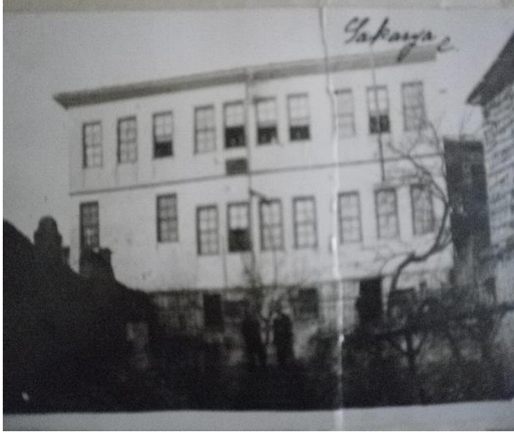
1948 Yılı Sakarya İlkokulu (Ahşap)